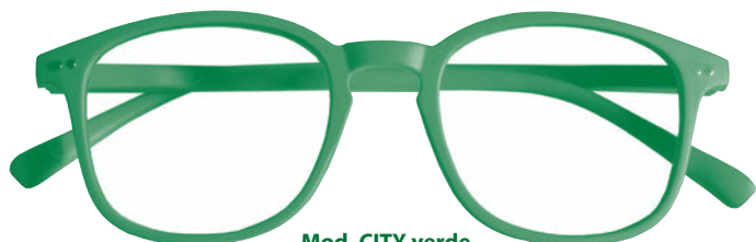
Mod. CITY verde

FORME ULTIMISSIMA MODA, GRANDE CAMPO VISIVO!