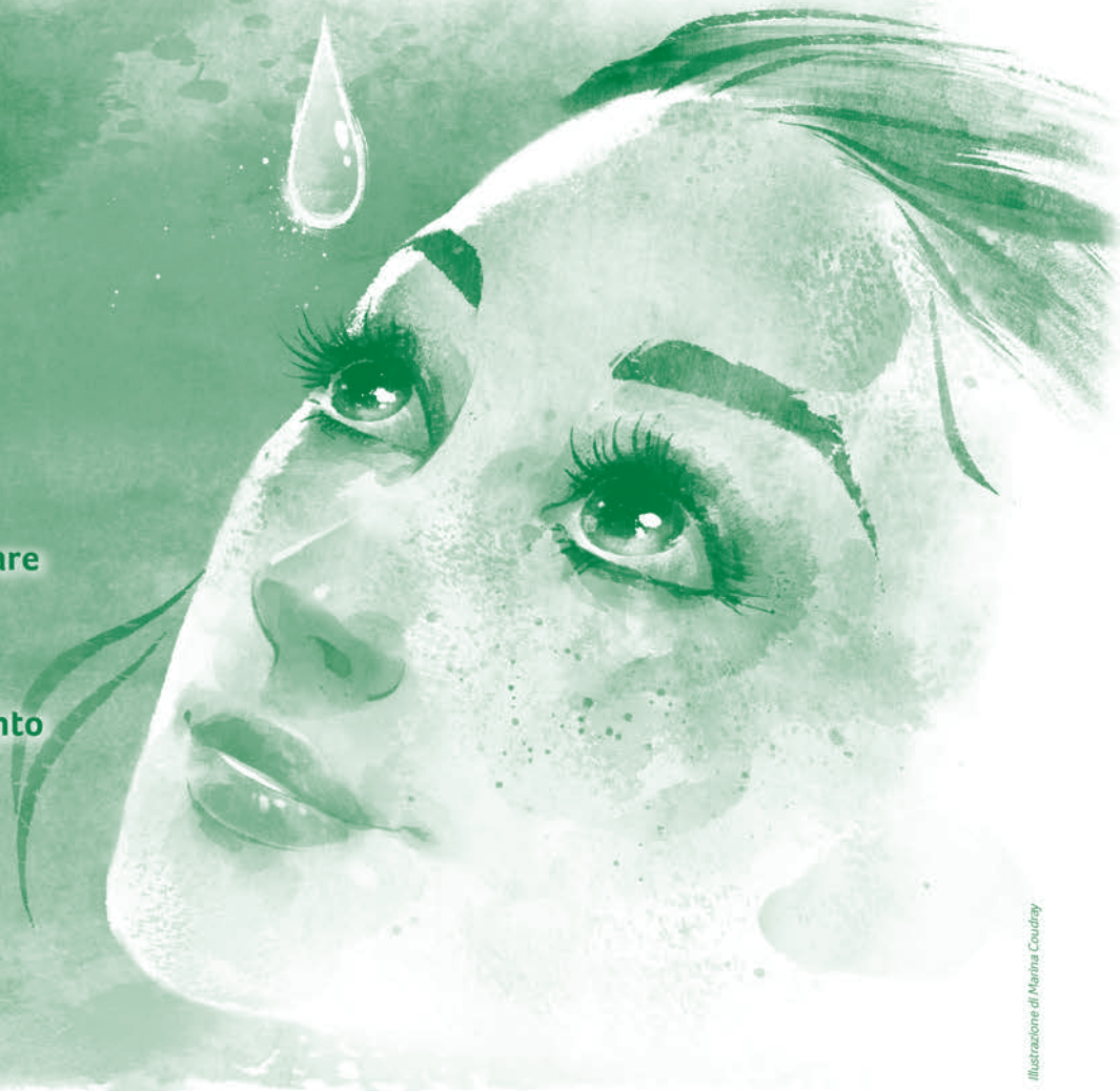
Illustrazione di Marina Coudray

I medicinali omeopatici possono dare un rapido sollievo agli occhi stanchi, secchi, irritati per cause diverse: polvere, pollini, smog, raggi solari, cloro dell'acqua delle piscine, uso prolungato di videoterminali, lenti a contatto. I medicinali omeopatici esistono in specifiche forme orali come granuli, globuli e in colliri anche monodose e possono essere utilizzati da grandi e piccoli.