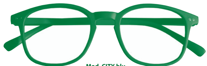
Mod. CITY blu