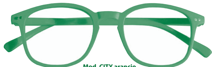
Mod. CITY arancio