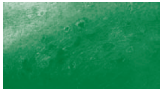
Figura 1: dermatite erpetiforme di Duhring: presentazione clinica

Tra le condizioni patologiche associate alla celiachia si trova la dermatite erpetiforme di Duhring , considerata la celiachia della cute. Si tratta di una patologia caratterizzata da lesioni simmetriche eritemato-papulose localizzate su superfici estensorie degli arti, capo, glutei e dorso, estremamente pruriginose e rispondenti alla dieta priva di glutine. La biopsia cutanea è indispensabile per la diagnosi e in oltre l'80% dei casi sono presenti le alterazioni tipiche a carico dei villi intestinali. La localizzazione cutanea si ritiene sia in rapporto con disfunzioni delle cellule di Langerhans e con iperdeposizione distrettuale di IgA (vedi figura 1 e 2 ).