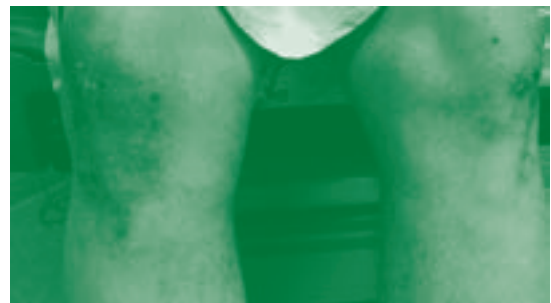
Figura 2: dermatite erpetiforme di Duhring: presentazione clinica

La correlazione con la psoriasi è parimenti nota, ma non se ne conosce il motivo; probabilmente si tratta di comuni associazioni genetiche.