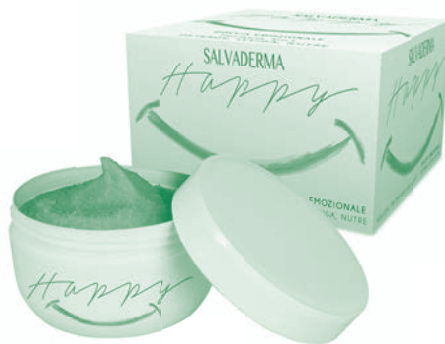
DOCCIA EMOZIONALE CON SALE ROSA DELL'HIMALAYA

7 ITALIANI SU 10 CONFERMANO CHE LA DOCCIA È IL LUOGO IDEALE DELLA CASA PER COCCOLARSI E RILASSARSI